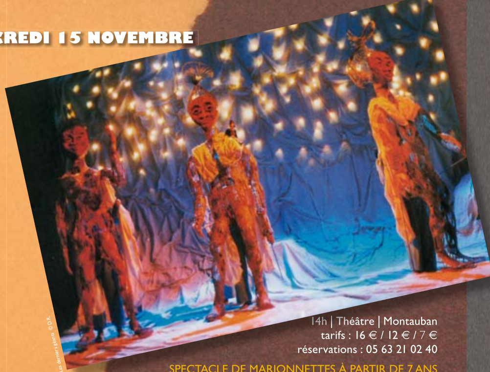
Les derniers géants

14h | Théâtre | Montauban tarifs : 16 € / 12 € / 7 € réservations : 05 63 21 02 40