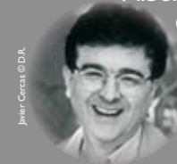
Javier Cercas

Rencontre avec Alberto Manguel et Javier Cercas