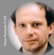
Denis Podalydès

La vie paraît paisible sur la côte québécoise où est installée la famille Berence. Mais les pleurs de Rebecca, la bonne argentine, le silence de la mère, qui vit en recluse, les interrogations précoces de la petite Ana révèlent des failles. C'est finalement le récit de la mère qui va dévoiler l'indicible. Elle raconte sa rencontre dans l'Algérie des années cinquante avec le capitaine Berence, un homme sensible et posé. La douleur des parents déracinés et l'exil en France. Paris, sa vie d'épouse de militaire absent. Puis le départ pour l'Argentine, où le monde s'effondre : elle y découvre, par hasard, que l'homme qu'elle aime n'est pas étranger aux disparitions non élucidées qui touchent la population... Dans ce roman d'une poignante efficacité, Alberto Manguel montre, à travers une famille presque ordinaire, comment la violence d'Etat peut trouver un relais dans l'esprit d'un individu attachant et de haute conscience intellectuelle.