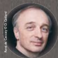
René de Ceccatty