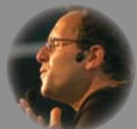
Marc Roger © S. Barthe