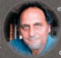
J.-C. Caron

Ludique, réjouissant, un rien provocateur, ce petit livre est une prise de position politique face à l'uniformisation de l'insignifiance.