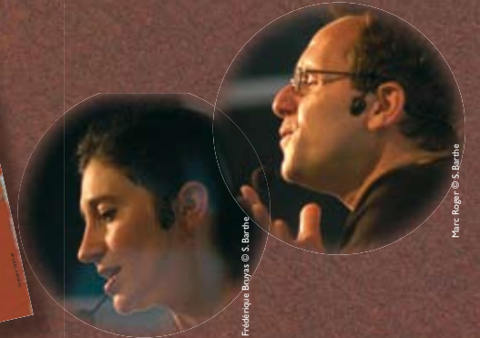
Frédérique Bruyas