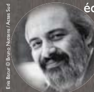
Enis Batur

Alberto Manguel a donc choisi de nous présenter l'œuvre d'Enis Batur, écrivain turc, auteur de plus d'une trentaine d'ouvrages (poésie, essais, prose) traduits en plusieurs langues. Cette rencontre sera ponctuée par la lecture d'extraits d' Amer Savoir et La Pomme .