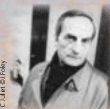
C. Juliet

Rencontres avec le céramiste et calligraphe, sur les lieux de son exposition. Voir p. 26