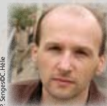
P. Senges©C. Hélié