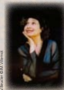
V. Beucler © JM. Villemot