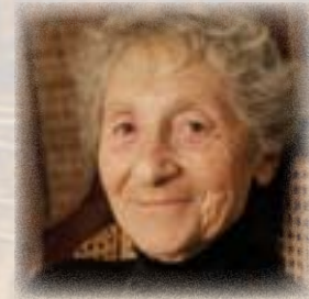
D. Epstein