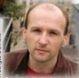
P. Senges