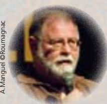
A. Manguel © Rournagnac