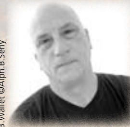
B. Walllet