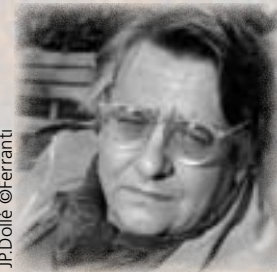
J.P. Dollé