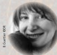
B. Guettier ©DR

L'après-midi au musée Ingres : tous les quatre ont carte blanche pour surprendre, réjouir petits et grands sans oublier les séances de dédicaces... Belle exposition à visiter et encore une grande fête des livres !