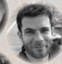
O. Tallec