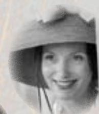
N. Novi ©Demange

Spéciale de marionnettes d'après la mythologie gréco-latine (dès 7 ans) Vivant et coloré ce spectacle est principalement créé à base de déchets plastiques et de divers emballages. Les marionnettes, le décor et les accessoires sont conçus autour de l'idée du détournement de matériaux de récupération.