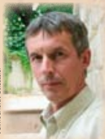
J.C. Mourlevat