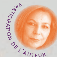
PARTICIPATION DE L'AUTEUR

Consulter la documentation jointe à ce programme ou téléphoner au 05 63 63 60 60