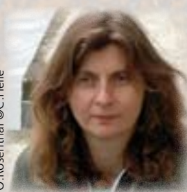
O. Rosenthal ©C.Hélie