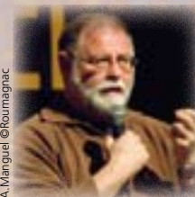
A. Manguel