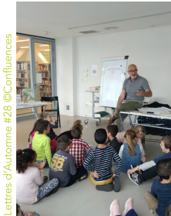
Lettres d'Automne #28 ©Confluences