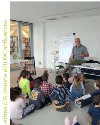
Lettres d'Automne #28